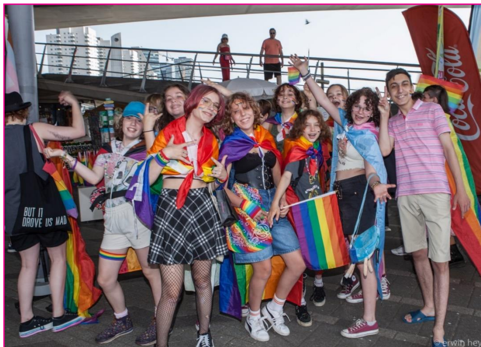
Deelname aan Rotterdam Pride

Wij opereren daarbij als een 'luis in de pels'. We zijn vastberaden en vasthoudend, en laten ons niet met een kluitje in het riet sturen. Wij houden vast, blijven monitoren en blijven sturen op resultaat voor onze community.