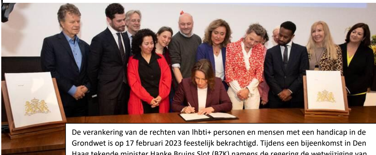
De verankering van de rechten van lhbtqi+ personen en mensen met een handicap in de Grondwet is op 17 februari 2023 feestelijk bekrachtigd. Tijdens een bijeenkomst in Den Haag tekende minister Hanke Bruins Slot (BZK) namens de regering de wetwijziging van D66, GroenLinks en PvdA, waar COC en Ieder(in) zo lang voor hebben gepleit.

Dit doen we met al onze eigenheid en verscheidenheid en willen de vanzelfsprekendheid om ons ook als zodanig te uiten. Dit is echter altijd een eigen keuze. Ondanks dat onze community in de meeste gevallen dezelfde rechten heeft als ieder ander, zien we in de praktijk van alledag dat er nog veel stappen zijn te zetten. Deze stappen zetten we niet door ons te conformeren of in te houden. Zichtbaarheid is van ontzettend groot belang om te laten zien dat we onderdeel zijn van deze stad. Door andere stadsgenoten te ontmoeten en te spreken, ontstaat er een wederzijds respect wat nodig is om een ieder de ruimte te kunnen zichzelf te zijn in deze mooie stad. Regenboog Alliantie Gouda zet zich in voor een Gouda waarin ieder lid van de lhbtqi+ gemeenschap zonder enige terughoudendheid zichzelf kan zijn en zich als zodanig kan uiten.